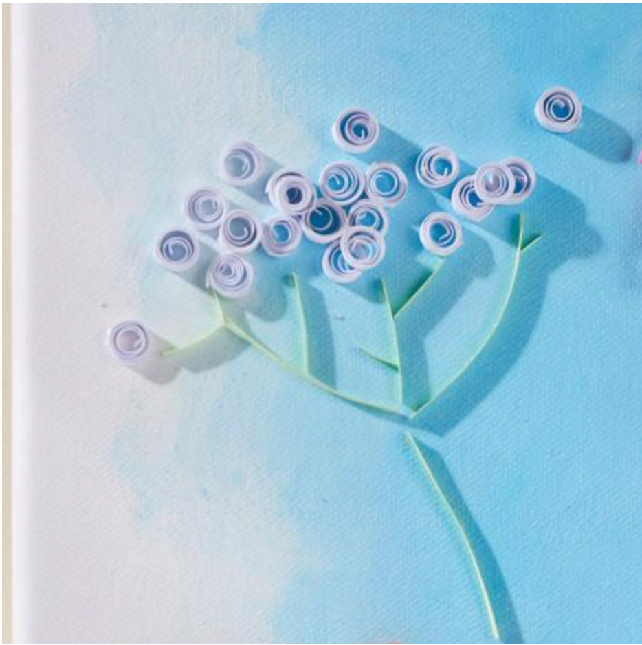
Duizendblad van Quilling