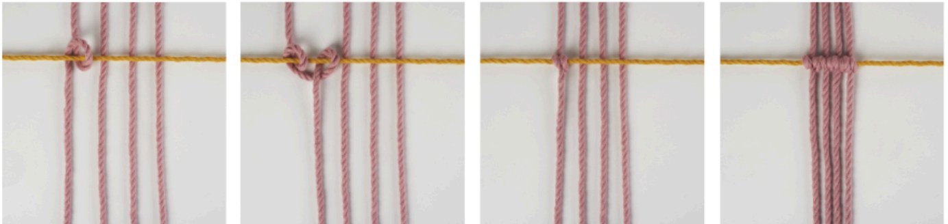
Rij 9 - 10 = Diagonale rib knopen