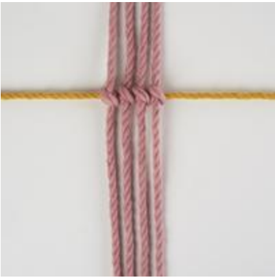
Rij 3-5: Vierkante knoop