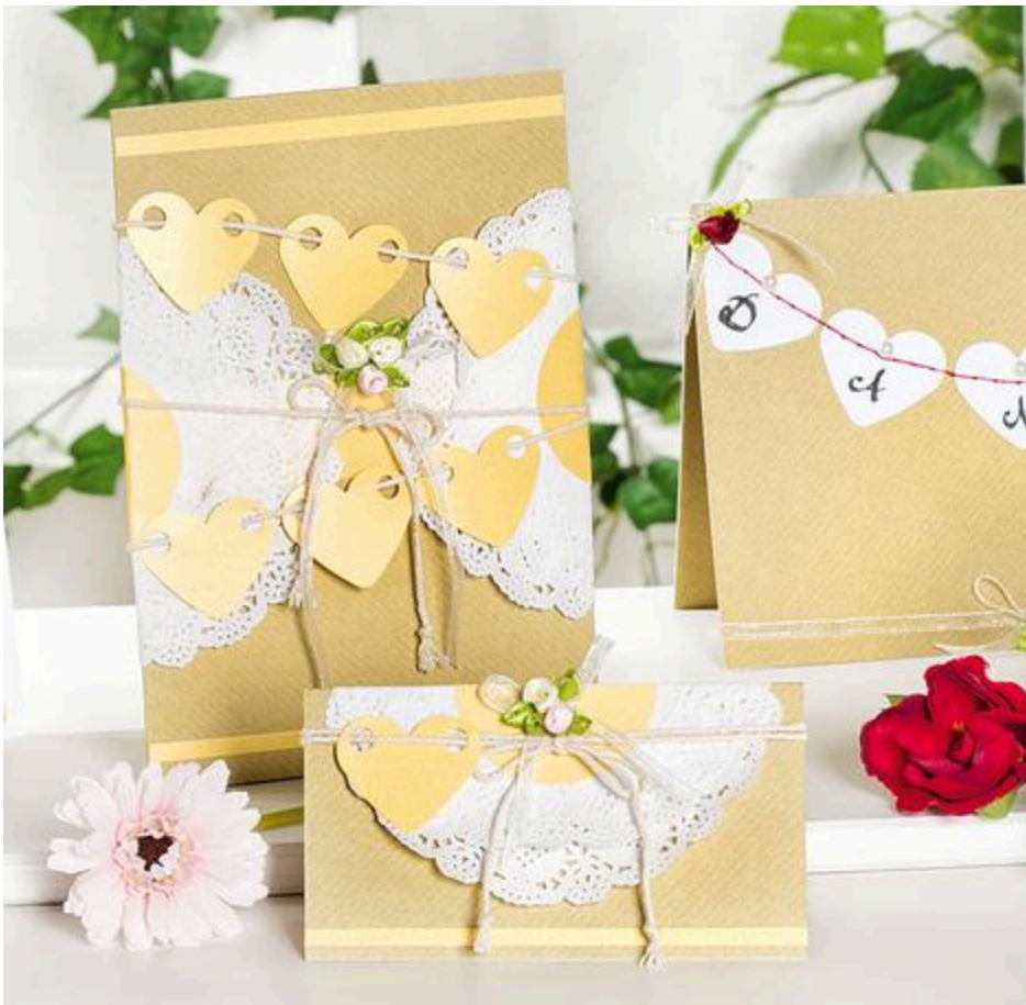
Vakantiekaarten met kantpapier en hartenslinger