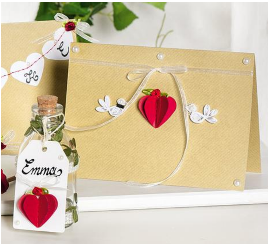
Kaarten met genaaide harten