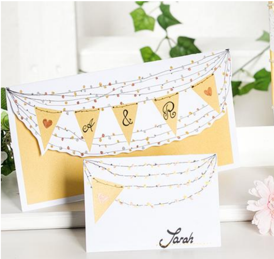
Trouwkaart met sprookjesverlichting

Extra tip: Een kadokaartje op een miniflesje kan een leuk minicadeau zijn voor de gast en tegelijkertijd een decoratief plaatskaartje.