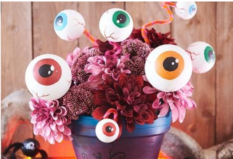
Halloweenversiering: griezelige piepschuim ogen